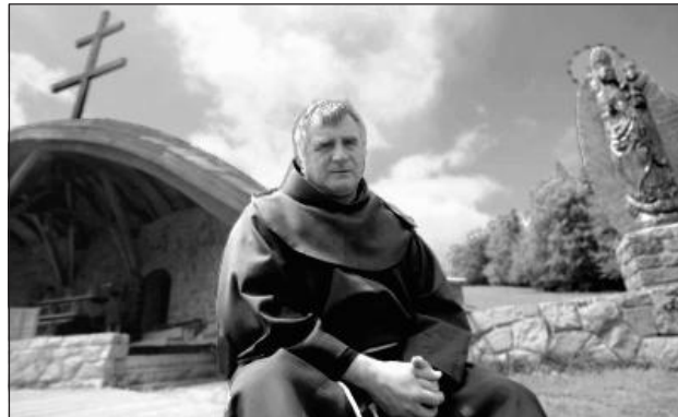
Az idei csiksomlyói búcsú ünnepi szónoka Böjte Csaba ferences szerzetes volt

Olyan döbbenet olvastam és örömmel gratuláltam Ervin atyának, hogy most a kolozsvári táblabíróság kimondta: semminek nyilvánítják annak a politikai pernek a végzetését, amelyben őt is halálra ítélték, és utána életfogytiglant kapott. Éveket, évtizedeket kell várni az igazság diadaláig,