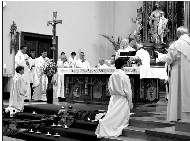
A szerzetesközösségek szétszórásának hatvanadik évfordulója alkalmából tartott szentmise a budai ciszterci Szent Imre-templomban