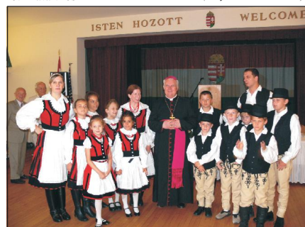
Bérmálási ünnepségen Chicagóban